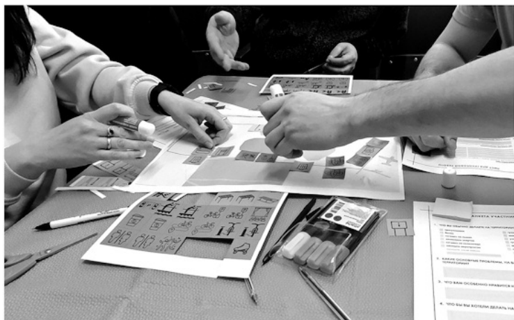
На проектировочной сессии жители посёлка могли выбрать наполнение проекта благоустройства

— Встречаемся и общаемся с жителями небольших населённых пунктов, где в 2025 году по президентскому нацпроекту «Жильё и городская среда» планируется благоустройство общественных территорий. Сначала