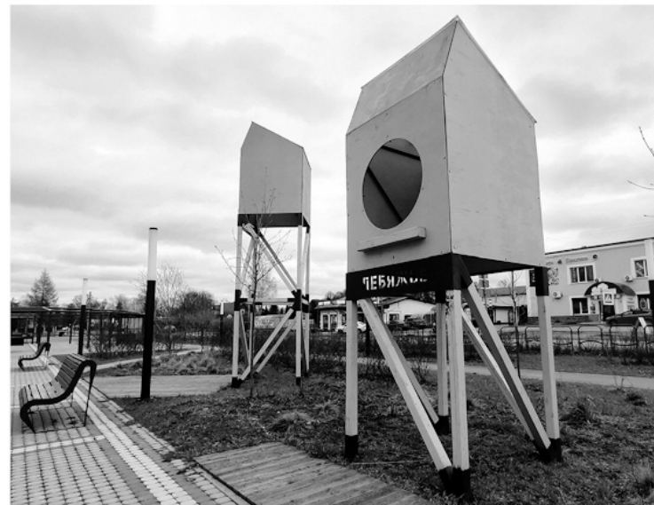
Птичья площадь в посёлке Лебяжье