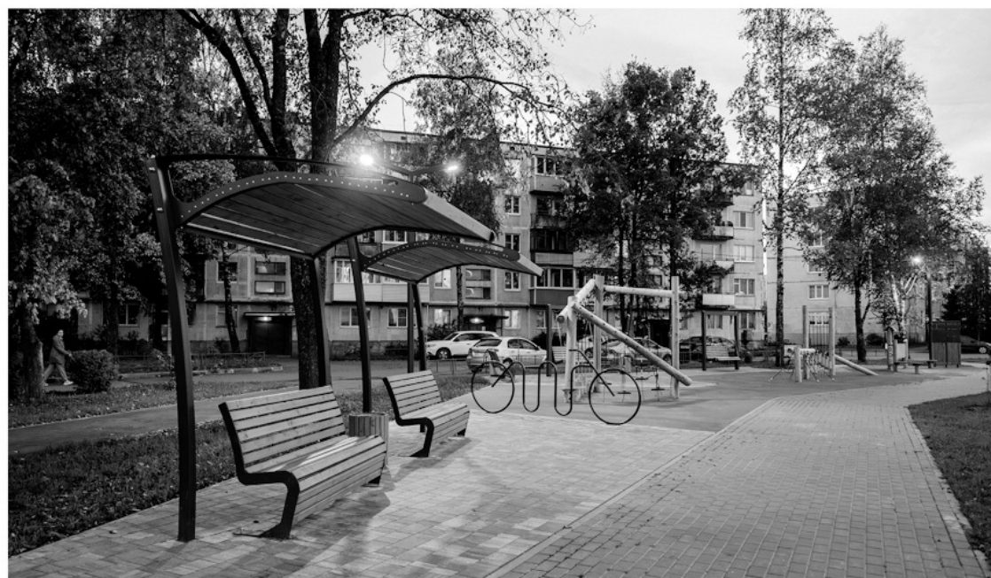
Общественное пространство в Пудомьягах вошло в список лучших объектов благоустройства Минстроя РФ

ленинградцы на региональной платформе в онлайн-формате выбрали места для проведения работ, а теперь проектировщики и архитекторы готовят проекты с учётом обсуждений на сессиях соучаствующего проектирования. Слышать жителей и учитывать их мнение — очень важно, потому что именно им там жить, отдыхать, проводить время с родными и близкими, —