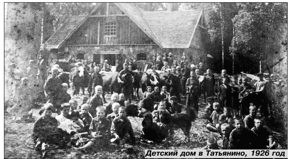
Детский дом в Татьянино, 1926 год