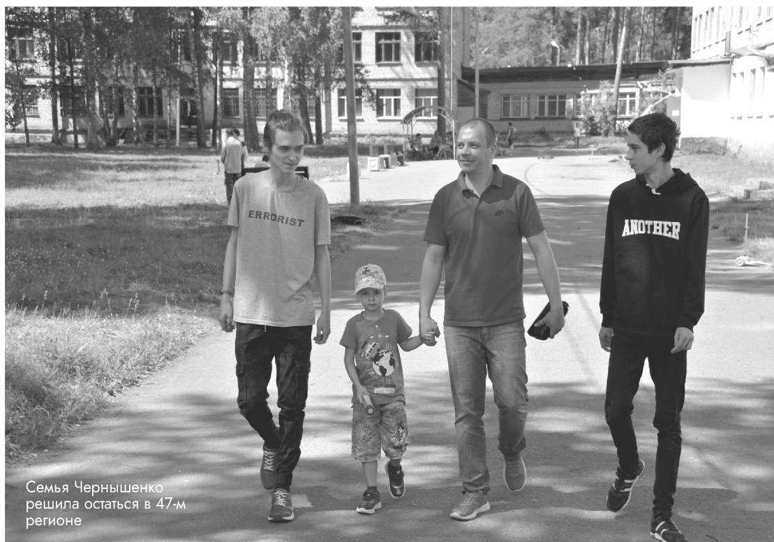
Семья Чернышенко решила остаться в 47-м регионе

– ПВР в Тихвинском районе – образец взаимодействия го-