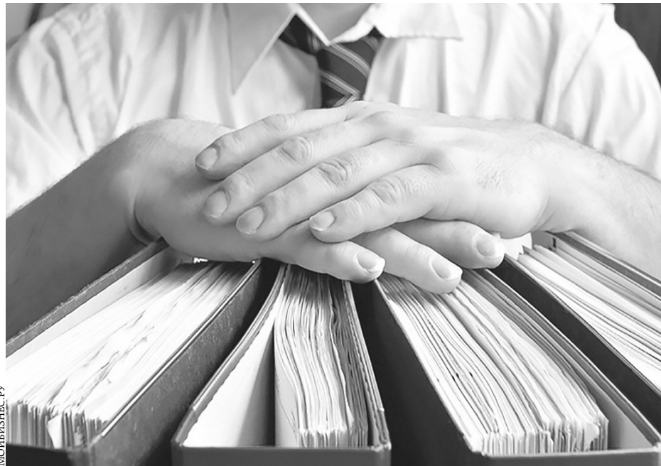
В 2020 ГОДУ ОРГАНЫ ПРОКУРАТУРЫ ЛЕНОБЛАСТИ ВЫДАЛИ КОНТРОЛИРУЮЩИМ ОРГАНАМ 535 ОТКАЗОВ В СОГЛАСОВАНИИ ВНЕПЛАНОВЫХ ПРОВЕРОК (28 % ОТ ОБЩЕГО КОЛИЧЕСТВА). ЗА НАРУШЕНИЯ ЗАКОНА 47 ДОЛЖНОСТНЫХ ЛИЦ ПРИВЛЕЧЕНЫ К АДМИНИСТРАТИВНОЙ ОТВЕТСТВЕННОСТИ.