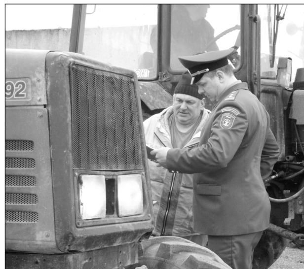
ложницах", "Торосово" - инженерная служба ответственно отнеслась к техосмотру.

- А как здесь в целом? - интересуюсь. - В "Сельцо" осмотрено 25 единиц техники. Два трактора и прицеп не прошли техосмотр из-за неисправного рулевого управления и светового оборудования. Эти трактора и прицепы выезжают на федеральную трассу - такие неисправности недопустимы в таких условиях эксплуатации. Впрочем, это недопустимо всегда. Ну и внешний вид машин должен быть опрятным, ведь это показатель культуры производства, отношения механизаторов к технике. В целом техосмотр в районе проходит на хорошем уровне. Отлично подготовили технику к весенним полевым работам в "Гомонтово", "Рабитицах", "Ка-