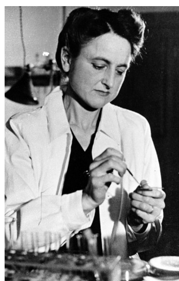
● З. Ермольева

запас его быстро иссяк. Болезнь возобновилась, и пациент умер. Несмотря на это наука торжествовала, так как было убедительно доказано, что пенициллин прекрасно действует против заражения крови. Через несколько месяцев ученым удалось накопить такое количество пеницилина, которого могло хватить для спасения человеческой жизни. Счастливец был пятнадцатилетний мальчик с заражением крови, которое не поддавалось лечению. Это был первый человек, которому пенициллин спас жизнь.