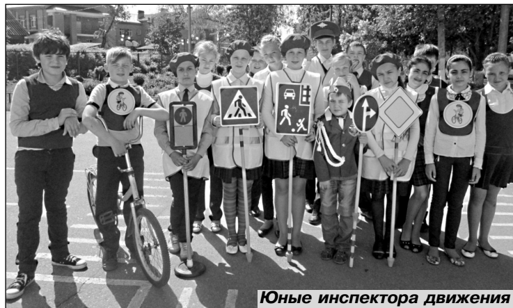
Юные инспектора движения