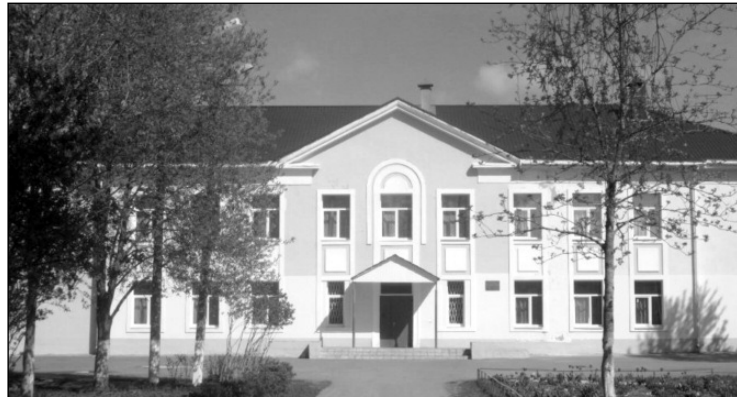
Волосовская средняя общеобразовательная школа №2

Многое менялось в жизни школы №2, но неизменными остались традиции, которые десятилетиями объединяют учеников, учителей и родителей в одну большую и дружную семью. Одним из таких направлений сегодня является