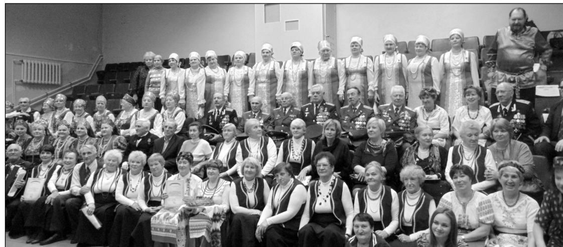
Материалы страницы подготовила Е. МИРОНЕНКО.