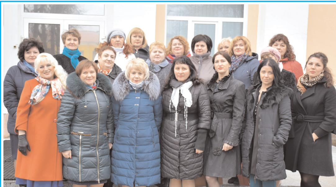
Работники культуры района в канун своего профессионального праздника.