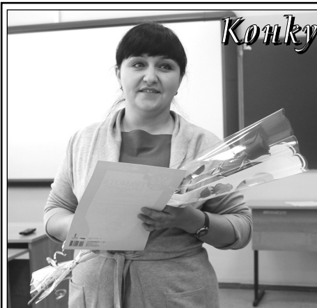
12 апреля в нашем районе прошел муниципальный этап конкурса среди классных руководителей. В нем приняли участие 6 самых лучших "классных дам".