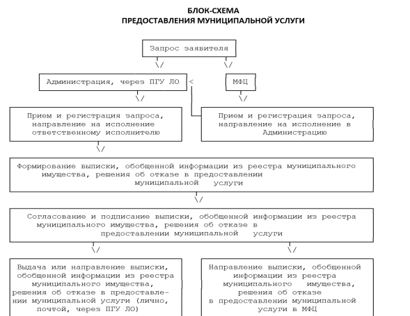
Приложение № 6 к Административному регламенту