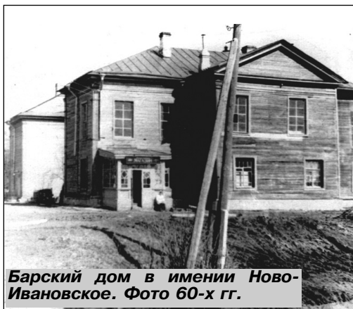
Барский дом в имени Ново-Ивановское. Фото 60-х гг.