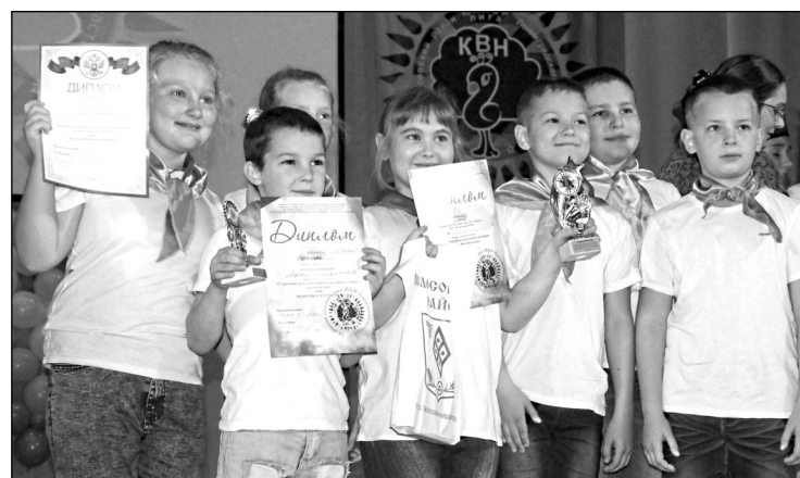
Материалы страницы подготовила А. МАРКОВА.

Поздравляем всех юных кавээнщиков и их руководителей с этой замечательной игрой! Продолжайте развивать свой талант, работать в команде, будьте открытыми и активными!