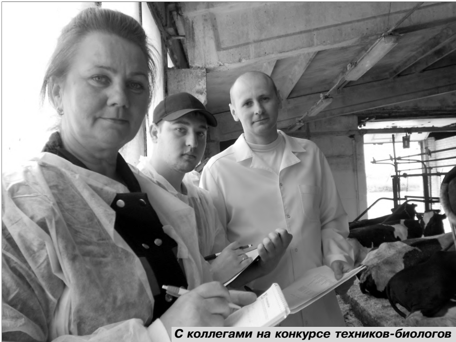
С коллегами на конкурсе техников-биологов