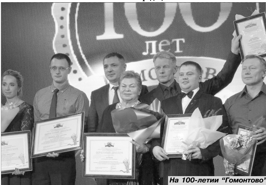
На 100-лети «Гомонтово»