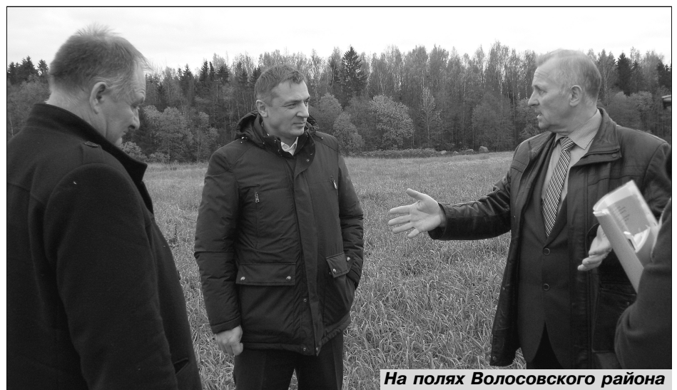
На полях Волосовского района

- Детей - трое. Две девочки и мальчик. Старшая закончила Санкт-Петербургский университет. Очень меня порадовало то, что получила приглашения сразу в три очень солидные организации, с которыми