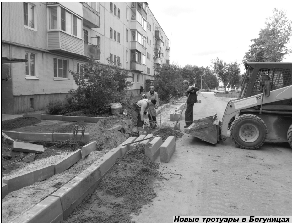
Новые тротуары в Бегуницах

гоньку, а в соответствии с четко разработанной программой наши проблемы с подачей тепла в многоэтажки стали решаться.