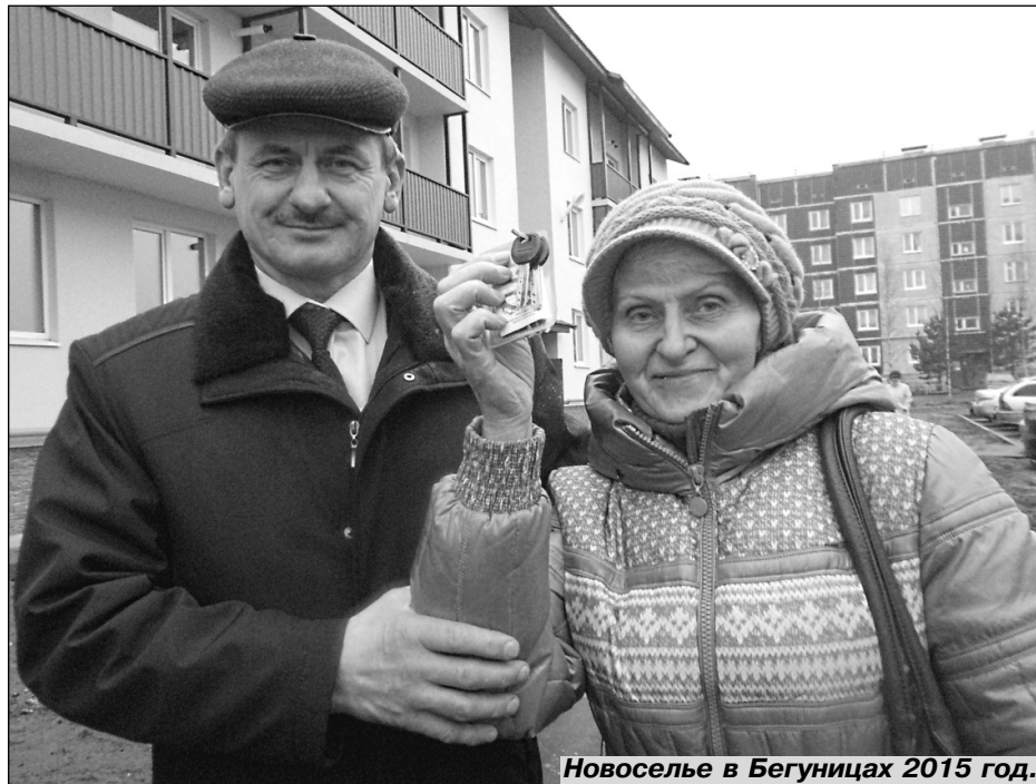
Новоселье в Бегуницах 2015 год.

Появились новые методы поддержки пожилых людей: