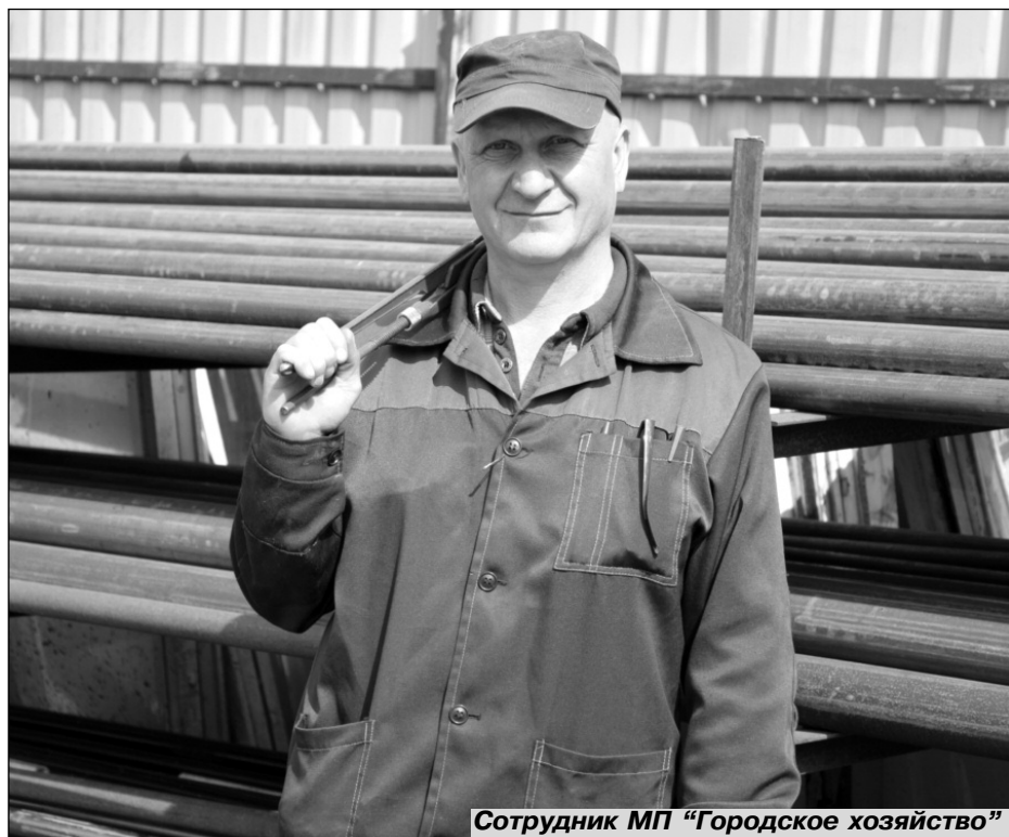
Сотрудник МП "Городское хозяйство"

Уже в 2011 году в план по расселению аварийного жилья по областной программе был включен аварийный дом в Бегуницах. Надо отметить, что успех вхождения в такую программу, в основном зависит от расторопности и энергичности местной админист-