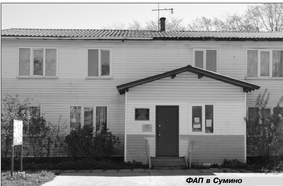
ФАП в Сумино