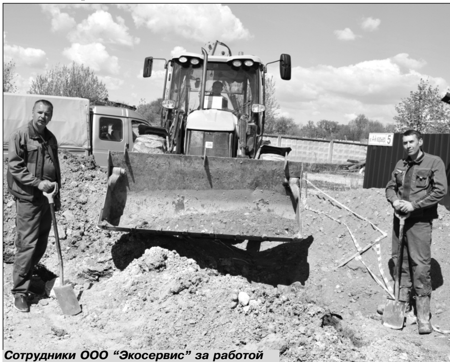
Сотрудники ООО "Экосервис" за работой