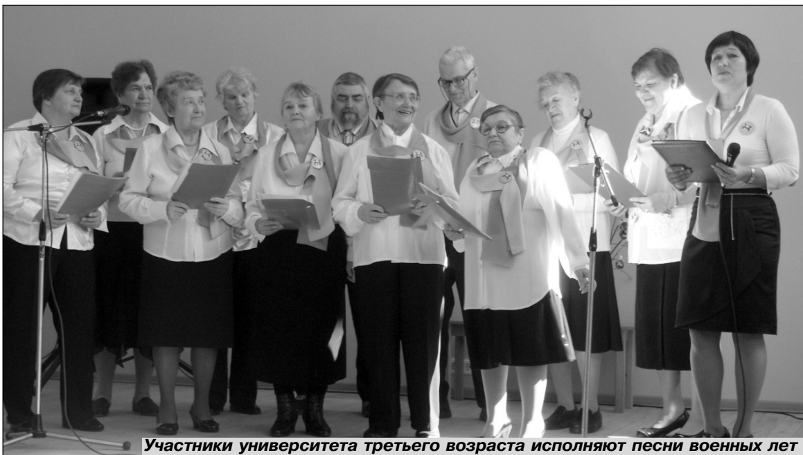
Участники университета третьего возраста исполняют песни военных лет