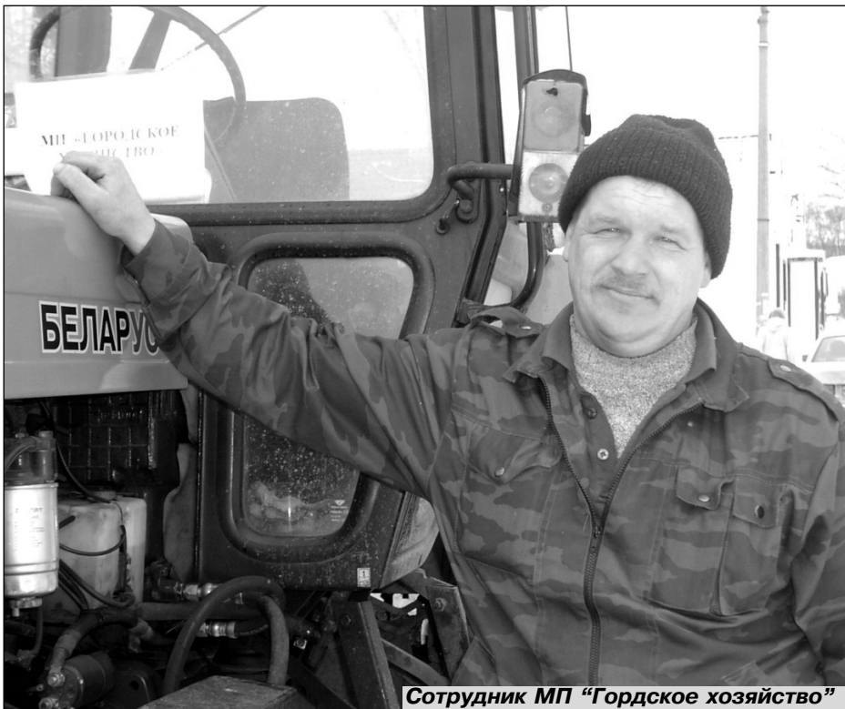
Сотрудник МП "Гордское хозяйство"

В 2012 году серьезно занялись и канализацией. В рамках программы "Чистая вода Ленинградской области" был объявлен аукцион на проектирование реконструкции КОСов в деревне Большой Сабск и поселке Курск. В дальнейшем планировалось разработать такие проекты и для Бегуниц, Губаниц, Зимитиц,