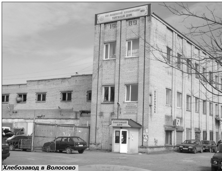
Хлебозавод в Волосово

И в целом к началу XXI века сельское хозяйство Волосовского района на фоне других районов и регионов все равно оставалось лучшим, имея самые высокие показатели по валовому производству молока, а также по урожайности зерновых и картофеля.