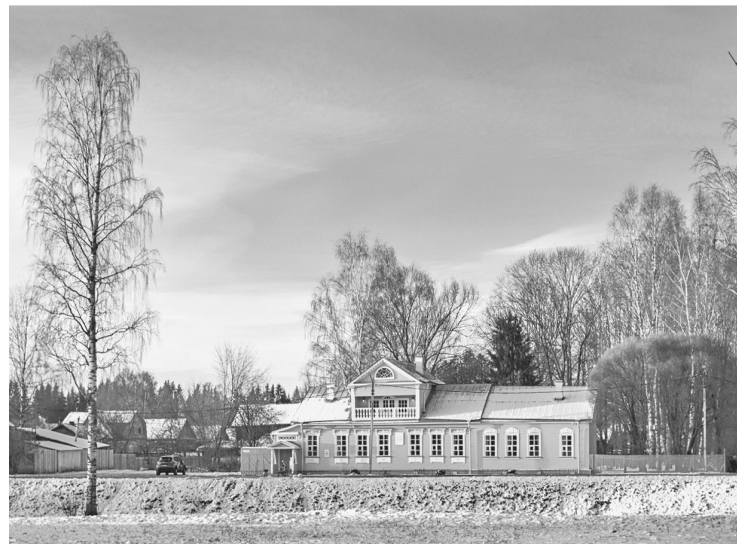
Дом-музей Н.А. Римского-Корсакова.

Усадьба Приютино принадлежала Алексею Оленину — президенту Академии художеств и Императорской публичной библиотеки. В пору расцвета на тер-