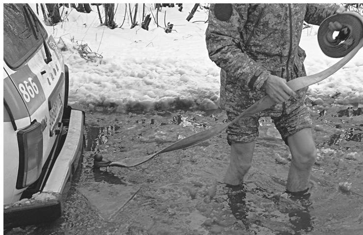
Целый час мы вытаскивали застрявшую в ледяной колее «Ниву»