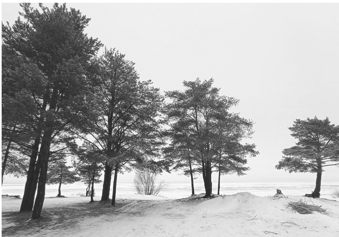
Государственный заказник «Коккоревский» — жемчужина юго-западного побережья Ладожского озера

— Зимой мы еженедельно проводим такие рейды в заповедниках региона по решению комитета государственного эко-