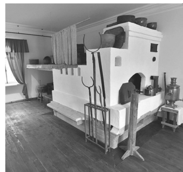
Музей «Дом станционного смотрителя»

КАКИЕ МУЗЕИ ПОСЕТИТЬ, ЧТОБЫ ПОГРУЗИТЬСЯ В НАСТОЯЩУЮ ЗИМНЮЮ СКАЗКУ