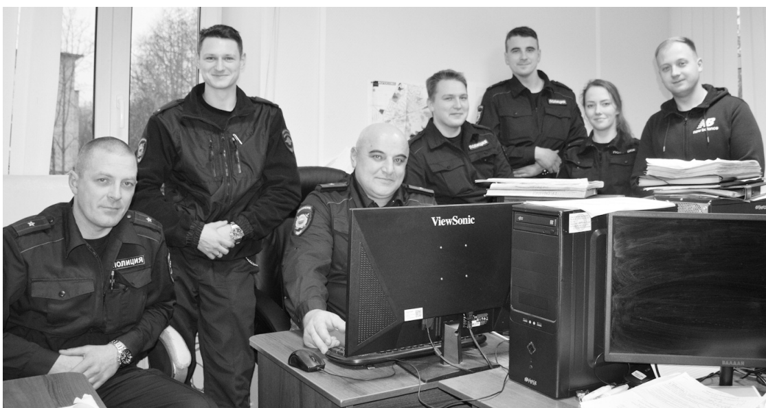
● В отделе участковых уполномоченных