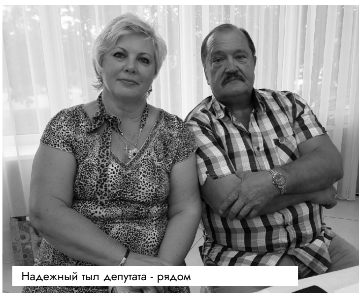
Надежный тыл депутата - рядом