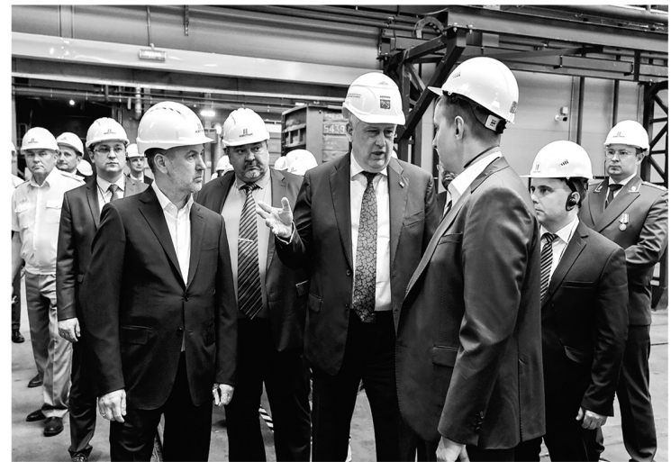
Ленинградская промышленность наращивает обороты несмотря на санкции

— Мы, наверное, единственный регион, где уже работают три отделения федерального фонда «Защитники Отечества» — во Всеволожске, Выборге и Гатчине. Скоро будем открывать ещё один — либо в Луге, либо