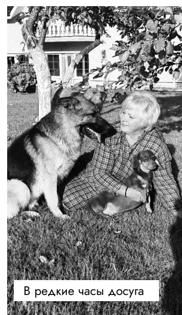
В редкие часы досуга

Людям все достойные, все переживают в хорошем смысле за свою работу, за регион и за свой район. Радует, что депутатский корпус пополняет интересная молодежь.