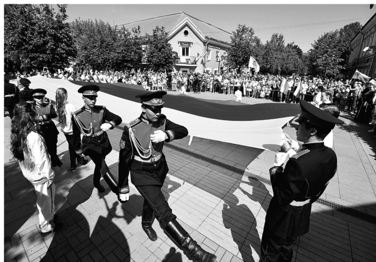
Патриотизм и взаимоподдержка объединяют ленинградскую семью

— Мы провели очень важное мероприятие для России — съезд молодых учителей со всей страны. Этот съезд проходил в Гатчине уже в четвёртый раз, и все воспринимают его как наше, ленинградское событие. Отмечу работу со школами — в них появляются IT-клубы, кванториумы, образование становится более цифровым и современным. В регионе активно открываются молодёжные