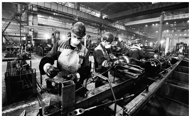
Безработица в регионе стремится к нулю, предприятиям нужны квалифицированные специалисты

— Вообще-то я считаю, что Ленинградская область обре-