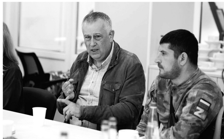
Александр Дрозденко на встрече с участниками и ветеранами СВО

— В лидеры постепенно выходит военно-промышленный комплекс. Да, он не такой большой, как в Санкт-Петербурге, но он заметно вырос. Развивается машиностроение, вагоностроение и судостроение, смежные с ними отрасли. В прошлом году мы ломали голову, как сохранить людей от увольнения на Тихвинском вагоностроительном заводе, а сегодня они допол-