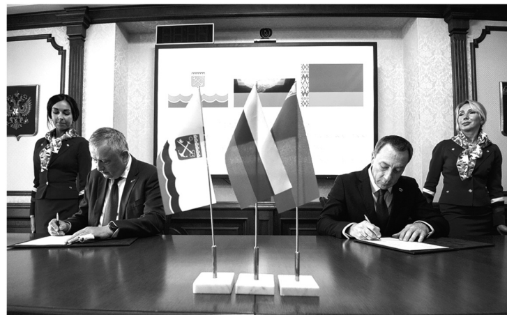
Главным международным партнёром 47-го региона остаётся Республика Беларусь