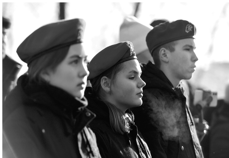
В регионе открываются новые центры военно-патриотического воспитания

А ведь ещё год назад нас относили к «красной зоне» — эксперты считали, что для Ленин-