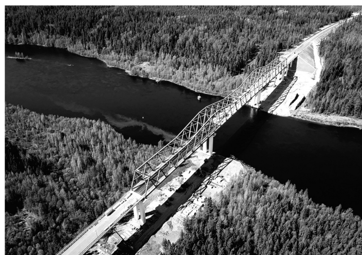
Строительство моста через реку Свирь стало историческим событием

Классификация книг такая: во-первых, всегда в ходу что-то лёгкое, например, детектив или авантюрный роман. Во-вторых, обязательно читаю какой-нибудь исторический труд. Недавно, например, в оригинале прочитал труды Ломоносова, сейчас читаю много об истории российской государственности — целыми сериями книг. В-третьих, люблю научно-популярные книги — будь то социология, культура или даже физика. Стараюсь изучать эти темы глубоко: ино-