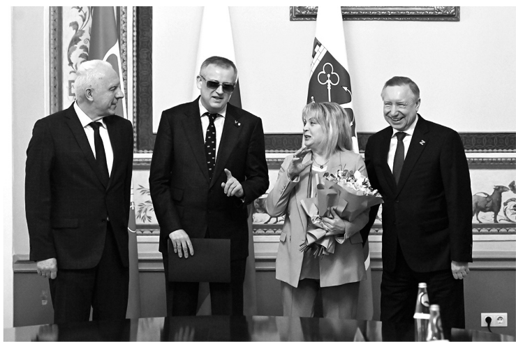
Элла Памфилова пообещала загадать желание между Александром Дрозденко и Александром Бегловым