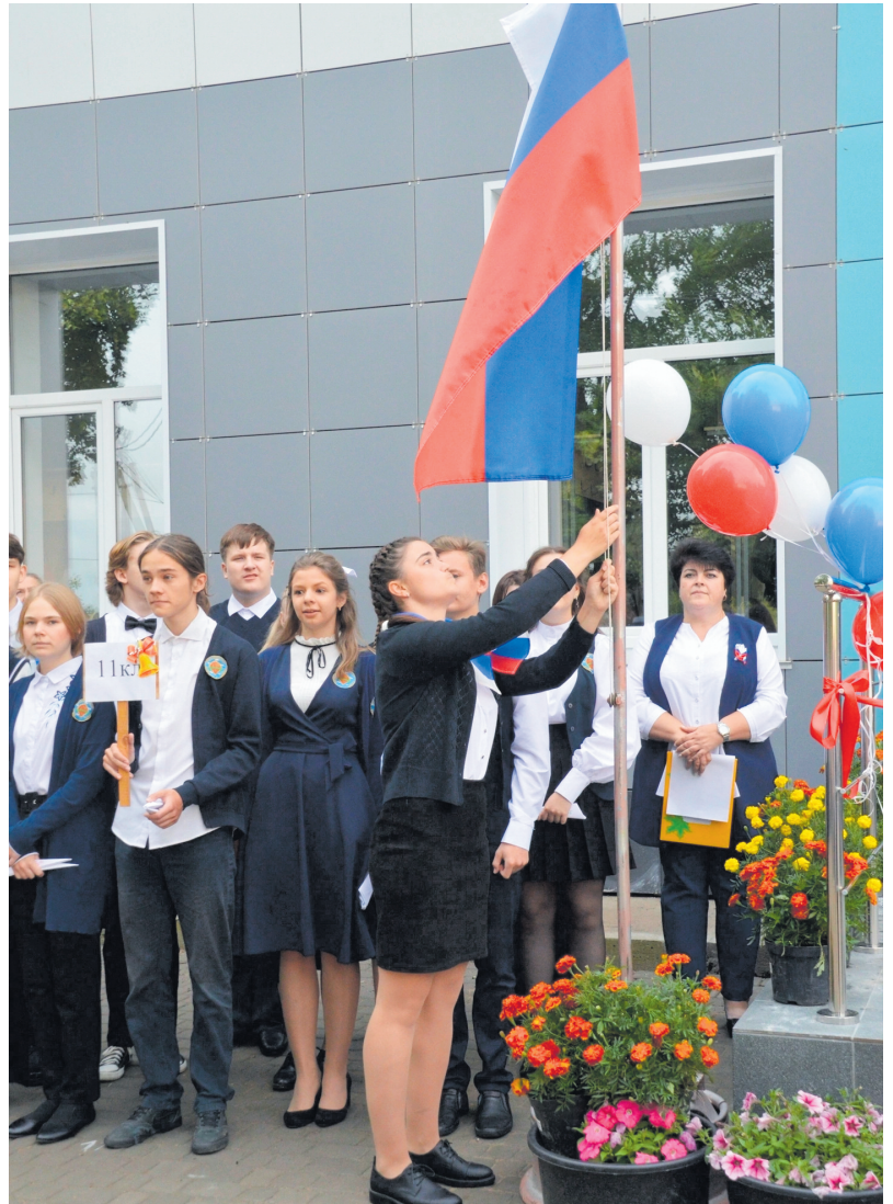
● Подъем флага в начале учебного года, Кикеринская СОШ

Государственные символы России — установленные федеральными конституционными законами особые отличительные знаки России, олицетворяющие ее национальный суверенитет и самобытность, несущие определенный идеологический смысл. Такowymi символами являются: государственный флаг, герб и гимн.