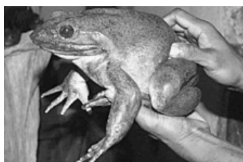
Самая большая лягушка

что даже занесены в Международную красную книгу как вымирающий вид. Размах крыльев этой бабочки доходит до 27 сантиметров, а самцы и самки существенно отличаются по окрасу и форме крыльев. Самки крупные: при длине тела в 8 см размах их закругленных крыльев достигает 28 см. А размах крыльев самцов достигает 17-20 см.