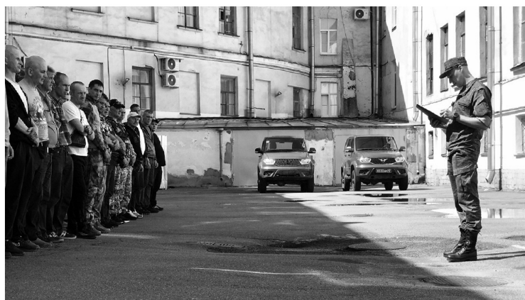
Мероприятие началось с построения и переключки добровольцев

— Уверен, что мои способности хорошего водителя там пригодятся. Знаю о ситуации «за ленточкой» от товарищей, которые уже побывали на фронте. Они, к счастью, вернулись домой живыми и здоровыми. И хотя наша служба, несомненно, связана с риском, я свой выбор сделал. Как говорится, есть такая профессия — Родину защищать, — делится своими мыслями житель Ленинградской области.