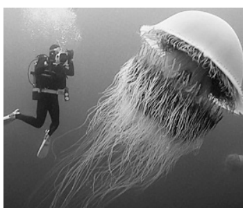
Самая большая медуза

Водоемы разных стран полны гигантских животных. Нет, вы не встретите в них мегалодона, он давно вымер. А вот гигантскую медузу - да. Она носит название волосистая цианея. Это не только самая крупная из всех медуз, но и самое большое животное в мире. Диаметр одной из медуз, найденной в 1870 году у побережья штата Массачусетс, превышал два метра, а длина щупалец достигала тридцати шести метров. Считается, что колокол цианеи может вырасти до двух с половиной метров в диаметре, а щупальца - до сорока пяти метров в длину.