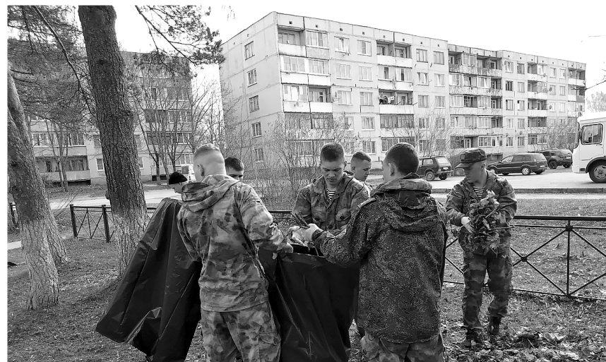
● Курсанты на Сабском мемориале