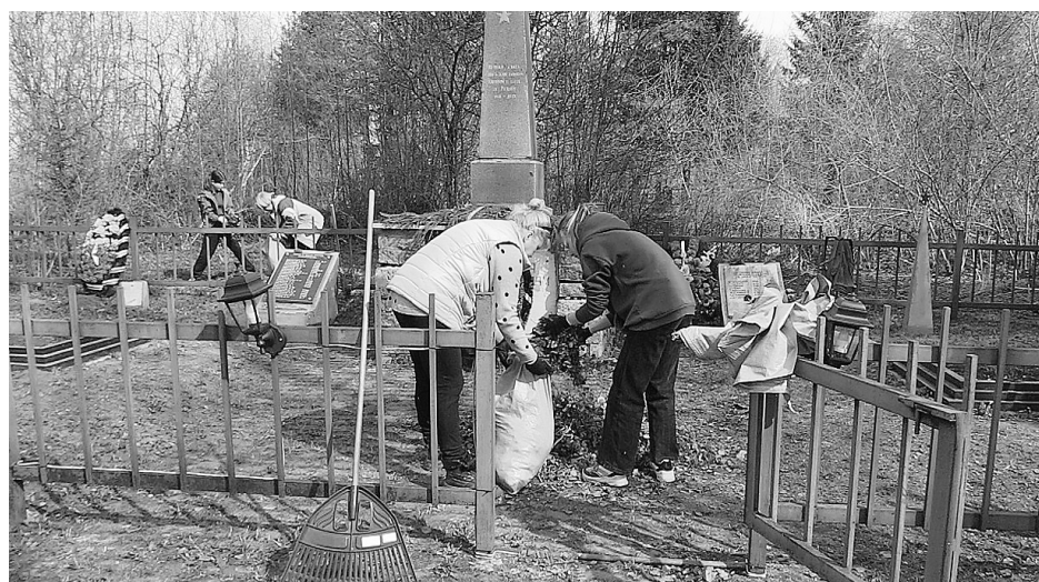
● Учащиеся Яблонницкой СОШ

Спасибо всем, кто принимал участие! [47]