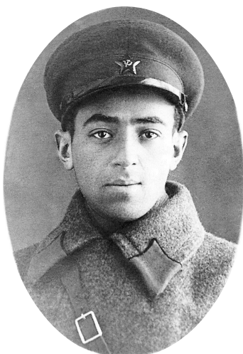
● Владимир Этуш, фронтовик

В годы Великой Отечественной войны деятели искусства бросили силы на помощь фронту. Кто-то - в прямом смысле, как, например, Владимир Этуш, который оставил учебу в Вахтанговском училище и ушел на войну. Другие помогали за линией фронта.