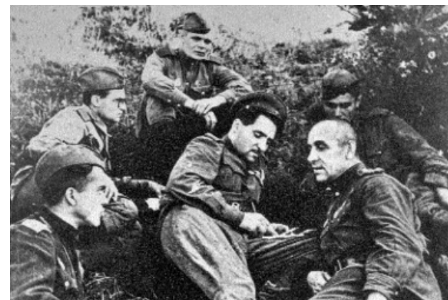
● Константин Симонов, военкор

В 1946 году печатают документальную повесть "В окопах Сталинграда" участника Сталинградской битвы Виктора Некрасова. Писатель Борис Васильев уходит на фронт добровольцем. После войны он напишет пронзительную повесть "А зори здесь тихие" (опубликована в 1969 году), роман "В списках не значился" об обороне Брестской крепости (1974), "Завтра была война" (1984) и другие ставшие классическими произведениями.