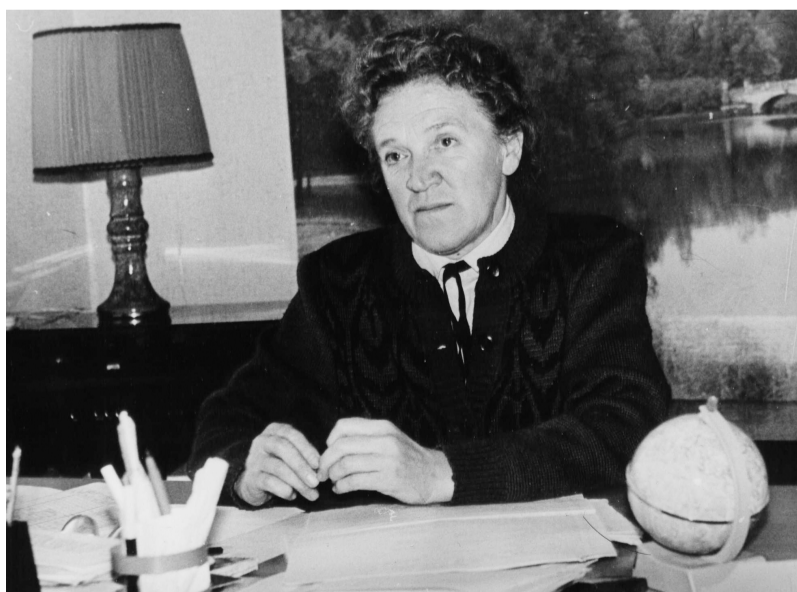
● Директор Волосовской школы №1