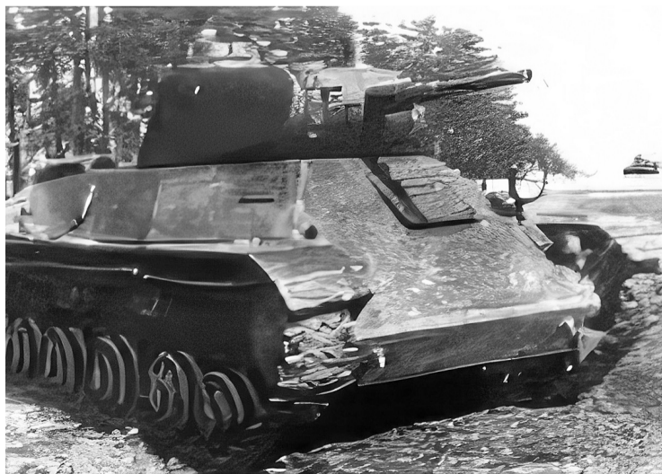
● Один из легких танков Т-50, находившихся под командованием Хрустицкого