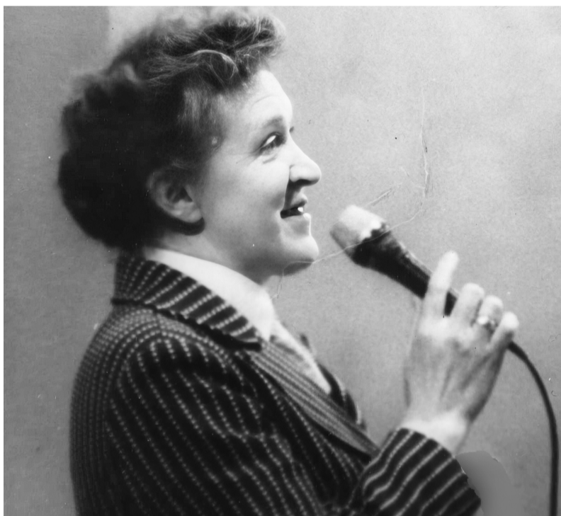
● Директор Бегуницкой школы