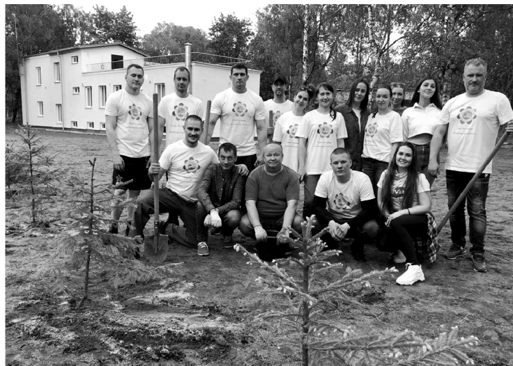
Активисты Союза высадили зелёную изгородь на территории детского хосписа

— Времена изменились — сегодня мы говорим уже не о выживании, а о развитии. Государство действительно заботится о дачниках и садоводах, оказывается серьёзная помощь. Можно вспомнить выделение 1 миллиарда 300 миллионов рублей на ремонт дорог, прилегающих к садоводствам. Это то, чего люди действительно ждут.