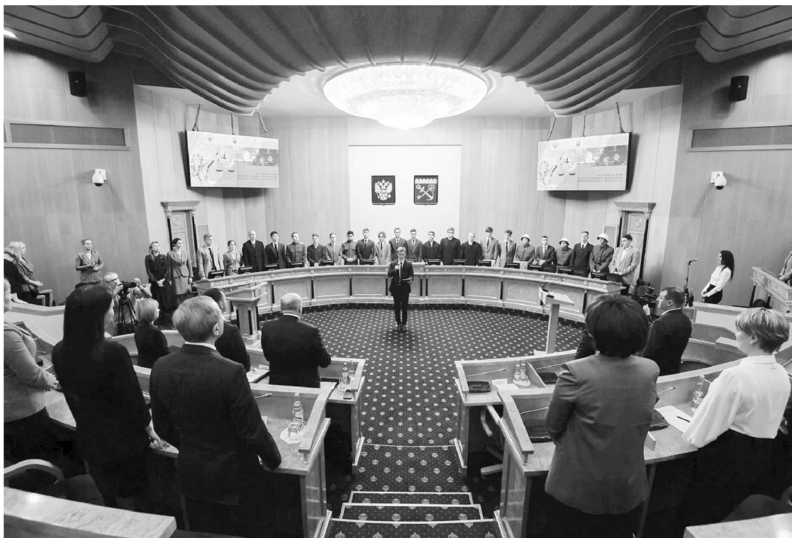
Будущие юристы посвятили документальную постановку всем жертвам нацизма