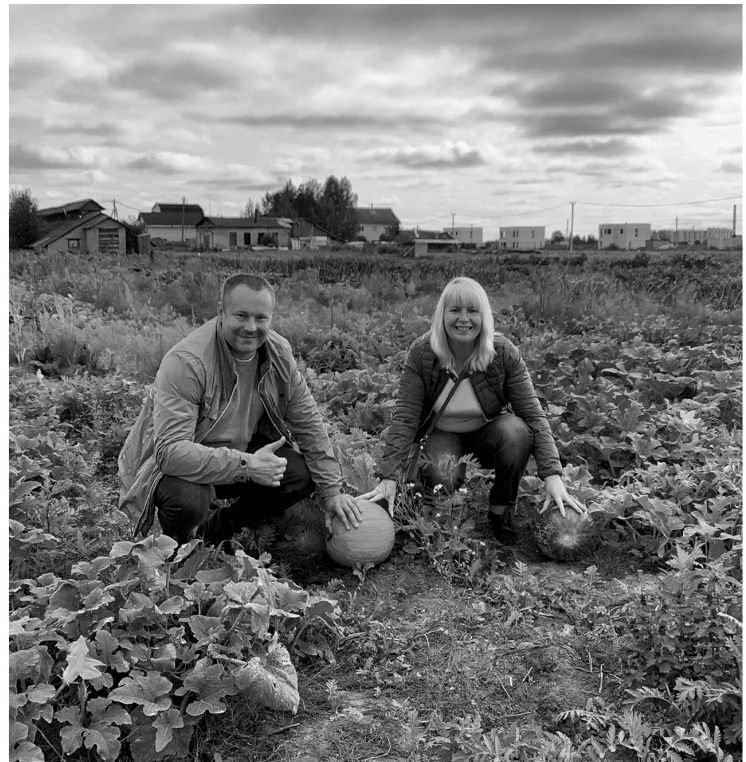
Новый глава организации и сам занимается садоводством

— Нам очень важно, чтобы все садоводства «от А до Я» вошли в наш союз. Представьте себе: если газификацию просит конкретное СНТ — это одно де-