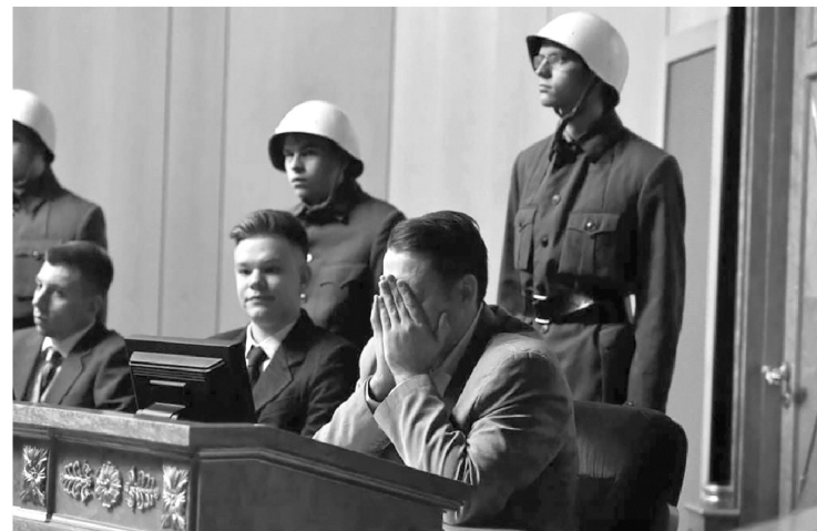
На скамье подсудимых оказались 24 обвиняемых

— Нюрнбергский процесс остаётся главным судом над нацистами, он касается и преступлений, совершённых на нашей земле. Три фронта — Ленинградский, Волховский, Карельский, более 1140 дней шли бои на территории нашей родной Ленинградской области, почти 900 дней