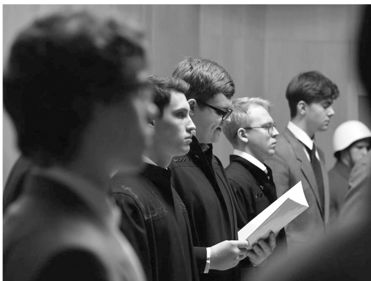
Судебный процесс в Нюрнберге длился на протяжении 10 месяцев