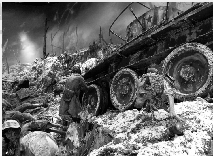
В музей-панораме «Прорыв»