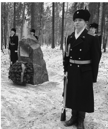
Мемориал жертвам нацистов в Гатчине

продлилась с 1941 по 1944 год. Нигде больше немцы не задерживались так долго. С самого начала народ столкнулся с массовым ограблением и репрессиями. Велось тотальное уничтожение евреев, коммунистов, просто активных жителей, которые выражали недовольство политикой захватчиков. Под конец оккупации фашисты перешли к массовой депортации советских граждан, людей просто низводили до уровня рабов.