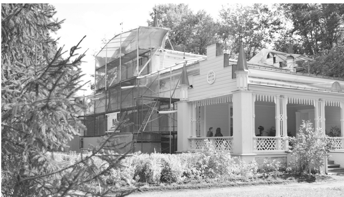
● Ремонт фасада усадебного дома