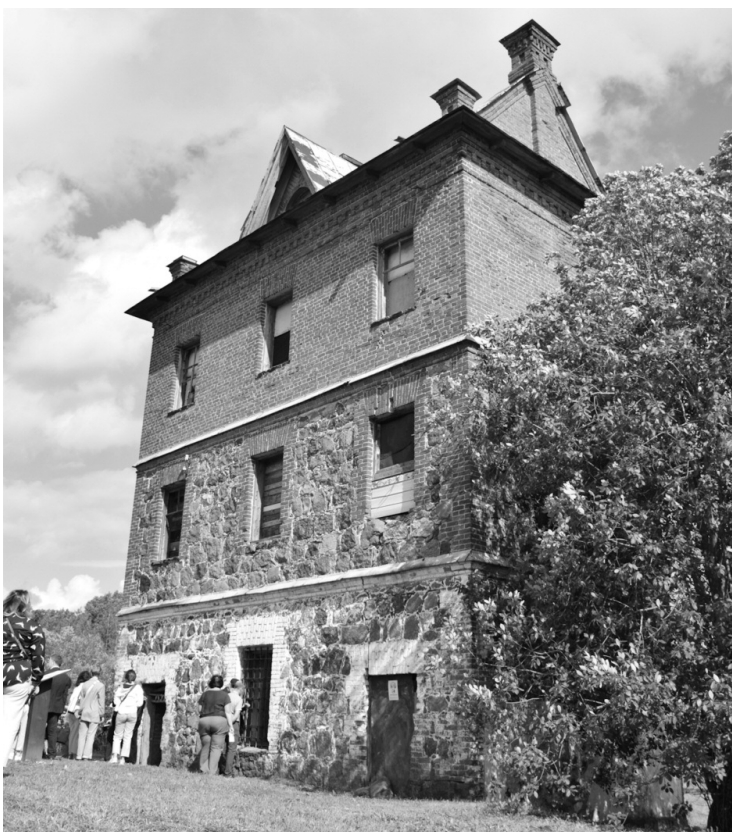
● Форелевая башня