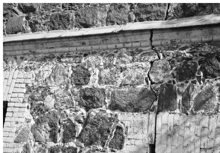
● Трещины в стенах башни