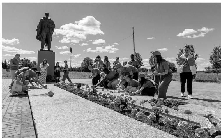
Молодёжь Ленинградской области принимает активное участие в патриотических акциях

БЕСЕДОВАЛА АНАСТАСИЯ КРУГЛОВА