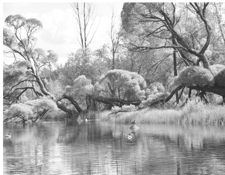
● В родниковом пруду идет своя жизнь

В Музее-усадьбе Н. К. Рериха открылась выставка «От Запада на Восток. Ленинградская область».