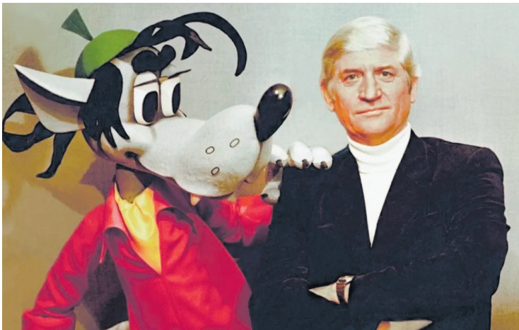
● Вячеслав Котеночкин

Все согласятся, что мультсериал "Ну, погоди!" является одним из лучших советских анимационных проектов. Как он получился таким? Расскажем.