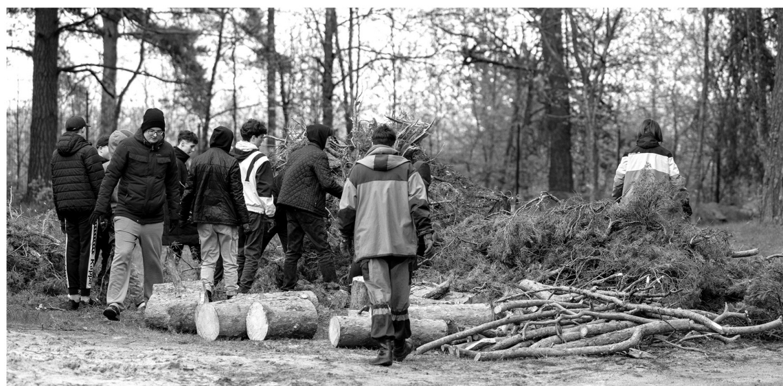
Участники «Ладожского десанта» делают добрые дела в районах Ленобласти

— Проект «СИМ БЕЗОПАСНОСТИ» существует уже более 10 лет. За это время мы посетили практически все районы Ленинградской области, получили письма поддержки от школ, у нас сложились добрые отношения с ГИБДД. В ближайшее время запланированы мероприятия в Тосненском,