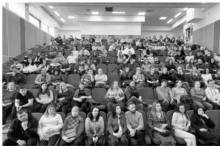
День открытых дверей в Перинатальном центре

Тенденция совместных родов находится на подъёме. В ближайшие годы около 30–40 процентов пар будут отправляться в родильное отделение вместе.