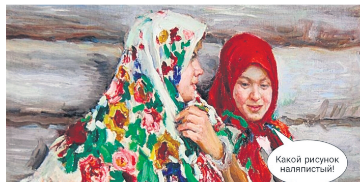
Какой рисунок наляпистый!

Калужницы получили свое название от старого русского слова «калуга», что означало придорожную яму с водой. Они действительно растут в воде, предпочитают ручьи с тальми водами и небольшие лесные речушки. Но мало кто знает, что при обеспечении их поливом калужницы неплохо себя чувствуют под сенью больших деревьев на богатых почвах. Это прекрасные теневые растения. В садах же их чаще можно увидеть в небольших декоративных водоемах.