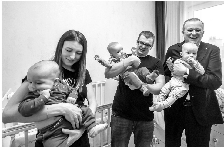
Александр Дрозденко на встрече с многодетными родителями