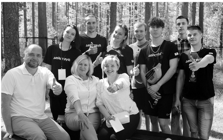
Молодёжная акция в Бокситогорском районе

Ленинградская область поддерживает социально ориентированные некоммерческие организации. По итогам первого конкурса грантов губернатора Ленинградской области-2024 поддержку на общую сумму свыше 109 миллионов рублей получили 60 НКО. В рамках второго этапа на социальные инициативы направят ещё 25 миллионов — итоги конкурса станут известны в июне. «Ленинградская панорама» пообщалась с действующими победителями конкурса грантов губернатора и узнала больше об их уникальных проектах.