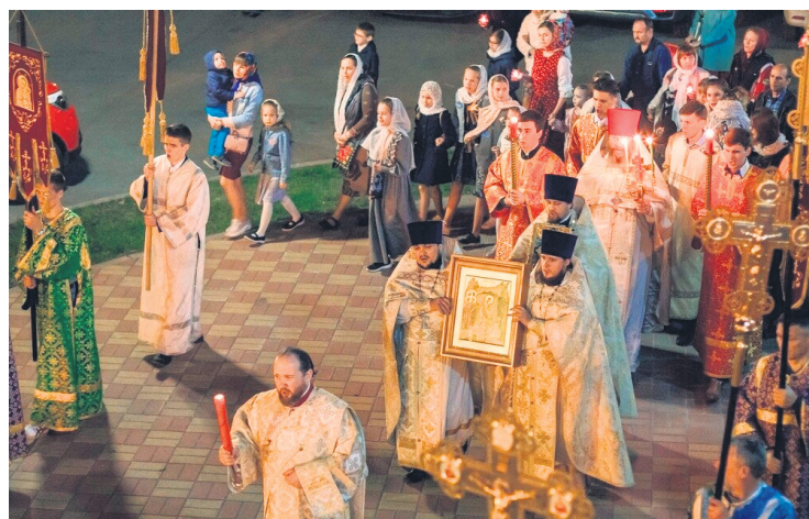
• Крестный ход на Пасху

кой канона Великой Субботы, повествующего о погребении Спасителя.