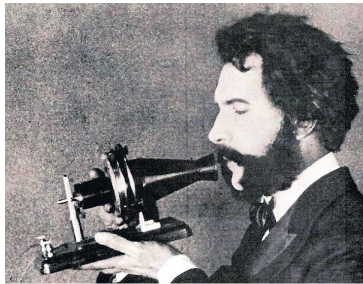
● Так выглядел первый телефон

В 1879 году состоялся первый междугородний телефонный разговор на линии Санкт-Петербург — Малая Вишера. 1 ноября 1881 года инженер фон-Баранов получил от правительства концессию на стро-