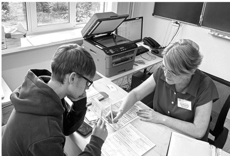
Приёмная комиссия техникума продолжает свою работу

АЛЕКСЕЙ АСТАПЧИК